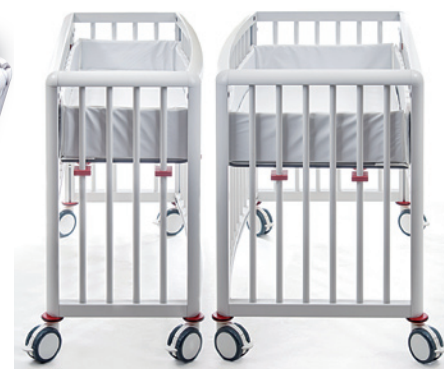
Abb.: Welcome bzw. Junior Welcome Twin bzw. Junior Twin