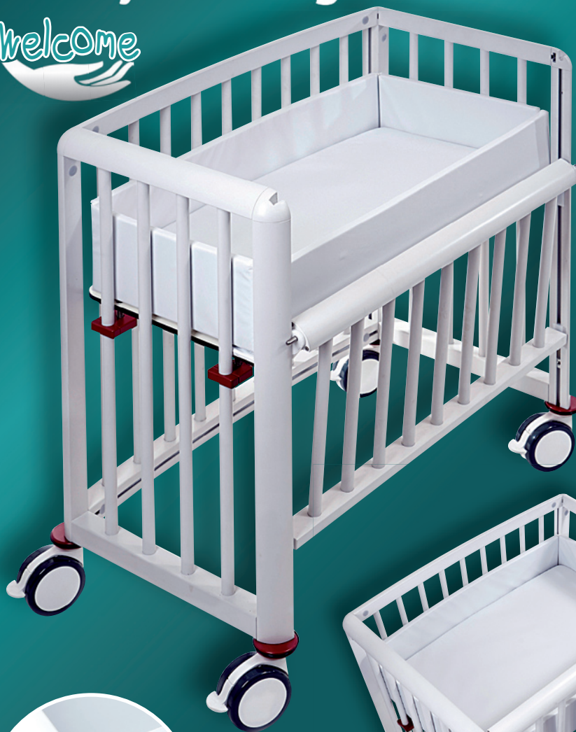
Abb.: Modell Welcome