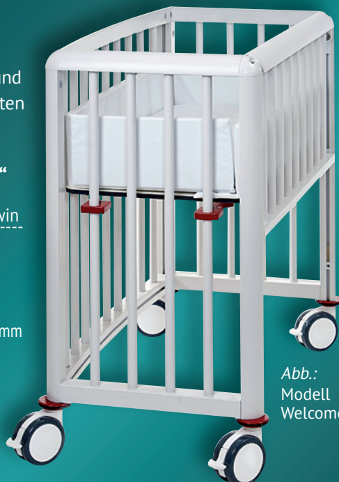
Abb.: Modell Welcome