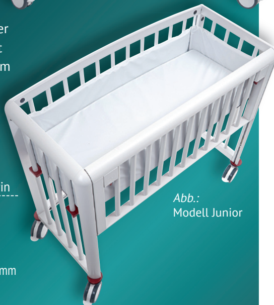
Abb.: Modell Junior