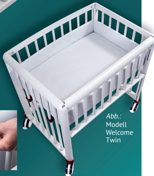
Abb.: Modell Welcome Twin