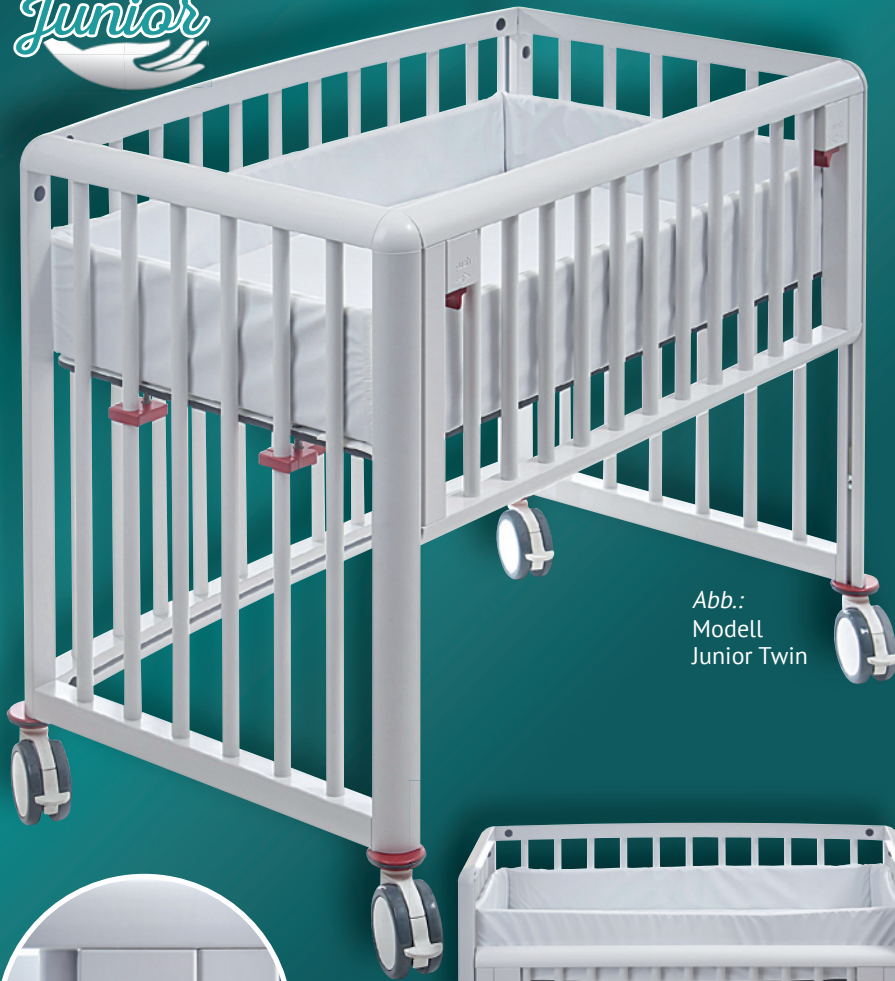
Abb.: Modell Junior Twin